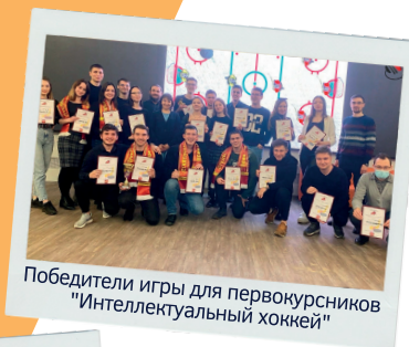
Победители игры для первокурсников "Интеллектуальный хоккей"