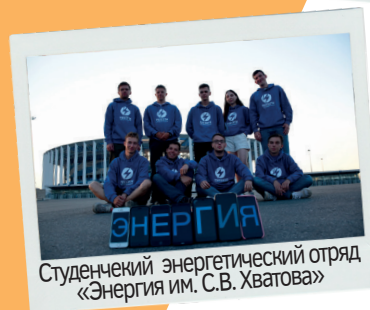
Студенческий энергетический отряд «Энергия им. С.В. Хватова»