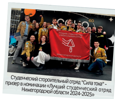
Студенческий строительный отряд "Сила тока" - призер в номинации «Лучший студенческий отряд Нижегородской области 2024-2025»