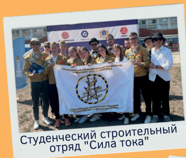
Студенческий строительный отряд "Сила тока"