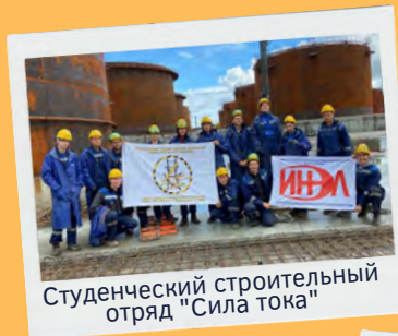
Студенческий строительный отряд "Сила тока"