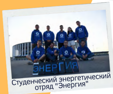
Студенческий энергетический отряд "Энергия"