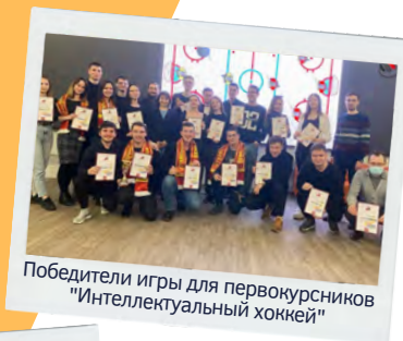
Победители игры для первокурсников "Интеллектуальный хоккей"