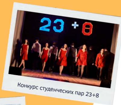
Конкурс студенческих пар 23+8